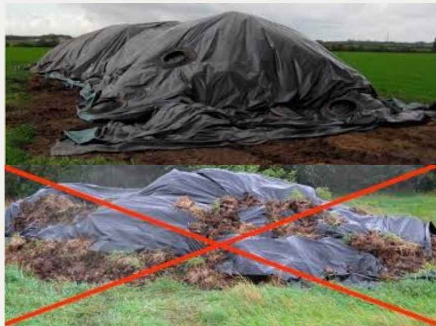
Billedbeskrivelse: Øverste billede viser en korrekt overdækket markstak. På det nederste billede er der anvendt gødning til at holde plastikken på plads, hvilket ikke er gangbart.

Markstakken må højst ligge det samme sted i 12 måneder, og en ny markstak må først lægges det samme sted igen efter 5 år. Du skal føre årlige optegnelser over, hvor dine markstakke er placeret og gemme optegnelserne i mindst 5 år. Optegnelserne skal omfatte oplysninger om oplagingsperiode og placering, for eksempel ved angivelse på et kort.